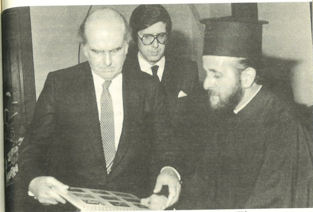
Ο ΟΙΚΟΝΟΜΟΣ ΧΡΙΣΤΟΦΟΡΟΣ ΜΕ ΤΟΝ ΑΝΔΡΕΑ ΠΑΠΑΝΔΡΕΟΥ ΣΤΗΝ ΑΘΗΝΑ. ΣΤΟ ΚΕΝΤΡΟ Ο ΝΙΚΟΣ ΣΕΡΓΙΔΗΣ.

νείται, ωστόσο, να συνεργαστεί για την ανεύρεση των λειψάνων τους και την επιστροφή τους στους συγγενείς τους.